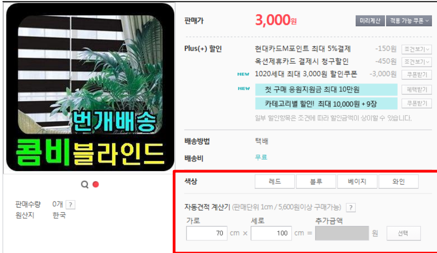
[주문옵션 펼쳤을 시]